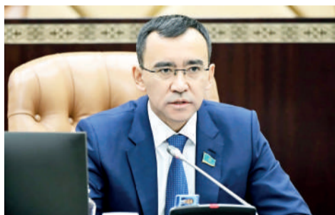
Мәулен ӘШІМБАЕВ, Парламент Сенатының Төрағасы:

Кеше қастерлі Бұрабай баурайында Ұлттық құрылтайдың төртінші отырысы өтті. Алқалы жиында Президентіміз Қасым-Жомарт Тоқаев елдің алдағы бағдарын айқындап берді. Онда соңғы кезеңде қоғамда қызу талқыланған өзекті мәселелерден бастап еліміздің әлеуметтік-экономикалық және саяси бағдарына қатысты басымдықтар түгел қамтылды.