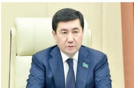
Ерлан ҚОШАНОВ, Парламент Мәжілісінің Төрағасы:

Кеше Президент Қасым-Жомарт Тоқаевтың қатысуымен Ұлттық құрылтайдың IV отырысы өтті. Ұлыстың ұлы күні қарсаңындағы дәстүрлі жиын бұл жолы Бурабайдың баурайында ұйымдастырылды.